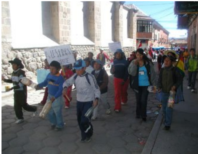
Los niños potosinos siguen movilizados pidiendo atención de las autoridades.