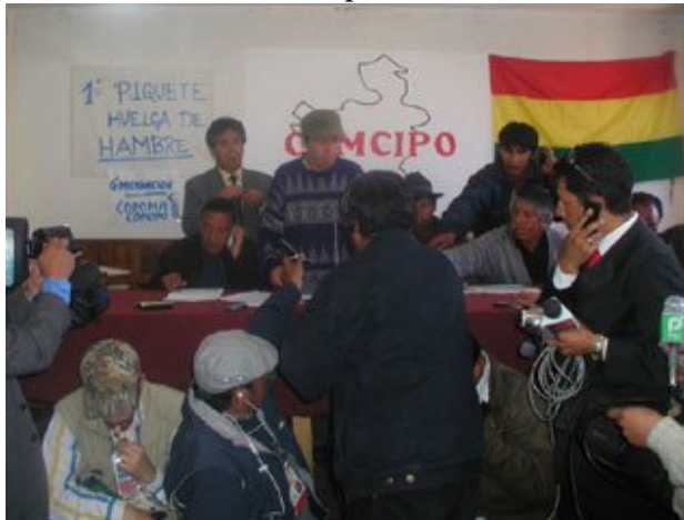
La reunión del pueblo potosino flexibilizó la posición de no negociar en Sucre.

Cuando esto ocurrió, una mujer que estaba cargando a su hijo dijo: “mátenme, aquí estoy, mátenme desgraciados” mientras lloraba desesperadamente.