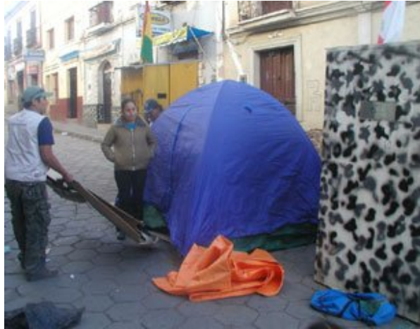
Los piquetes de ayuno voluntario se instalan en plena vía pública.