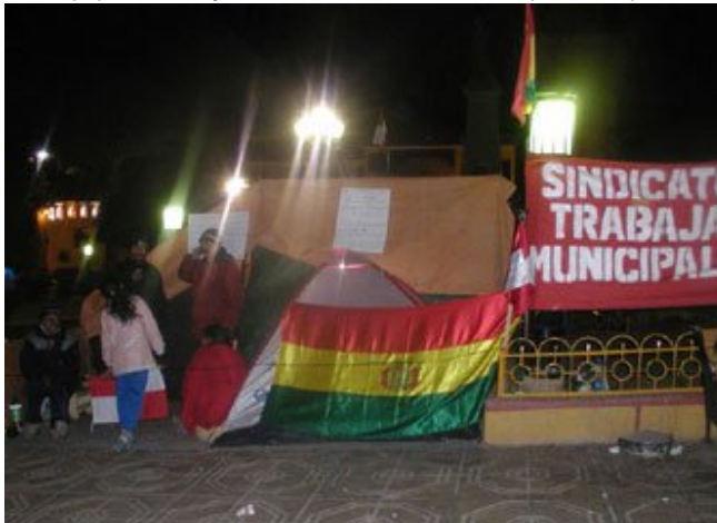
Afiliados de las organizaciones resguardan los centros de huelga de hambre.