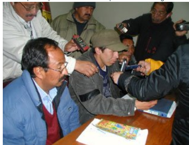
En la noche le leyó la respuesta del gobierno que pide levantar la huelga.