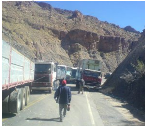
Los bloqueos de caminos también se mantienen invariables.