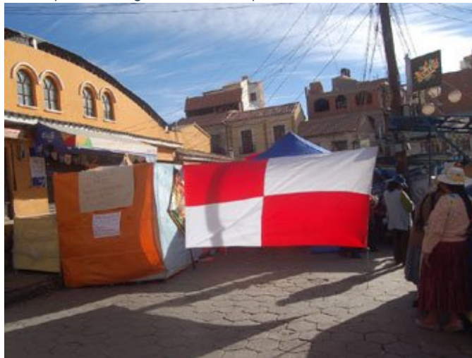
Los piquetes de huelga de hambre instalados en las calles son cada vez más.