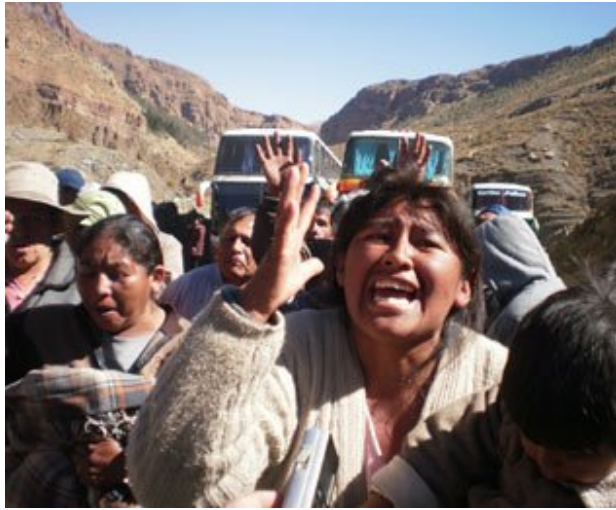
Las mujeres imploraron para pasar hacia la ciudad.